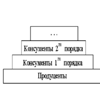
Трофическая пирамида в любой экосистеме