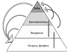
Модель трофической пирамиды в водной экосистеме